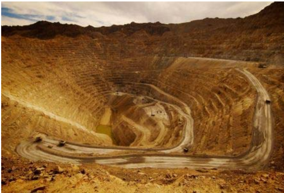
Emprendimiento minero Bajo de la Alumbreira, provincia de Catamarca. Anteriormente eran montañas como las que se ven en el fondo.

La característica más importante de la minería es que siempre implica una extracción física de la corteza terrestre, ya que requiere la eliminación de la vegetación existente, la excavación de grandes superficies y un trasiego de sustancias tóxicas (cianuro, arsénico y mercurio, entre otras), utilizadas en la separación del mineral, además de un enorme consumo de energía.